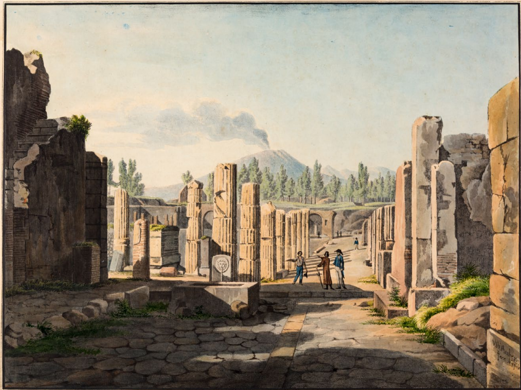
VUE DU FORUM EN VENANT DE LA RUE DES TOMBEAUX.