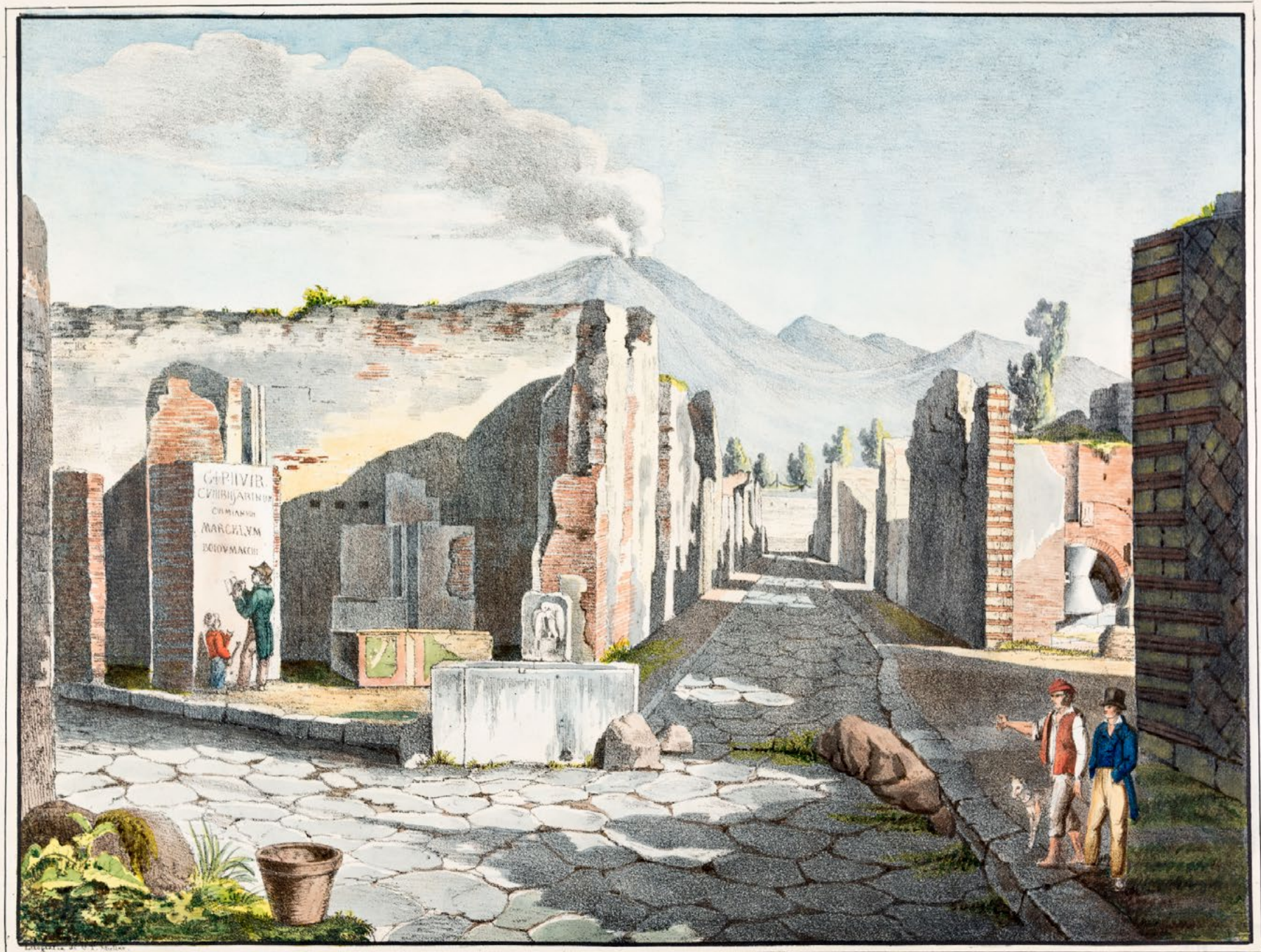
II. INTRESECTION DES RUES DE POMPEI.