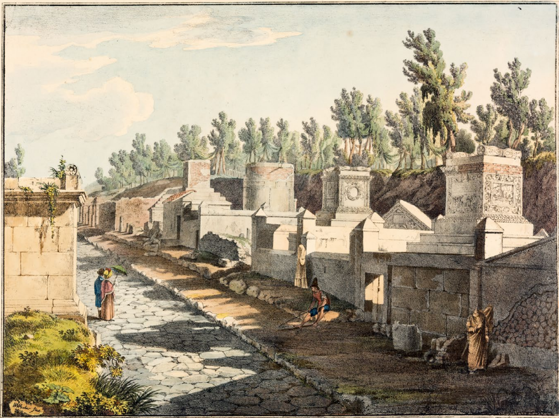
LA RUE DES TOMBEAUX A POMPEI.