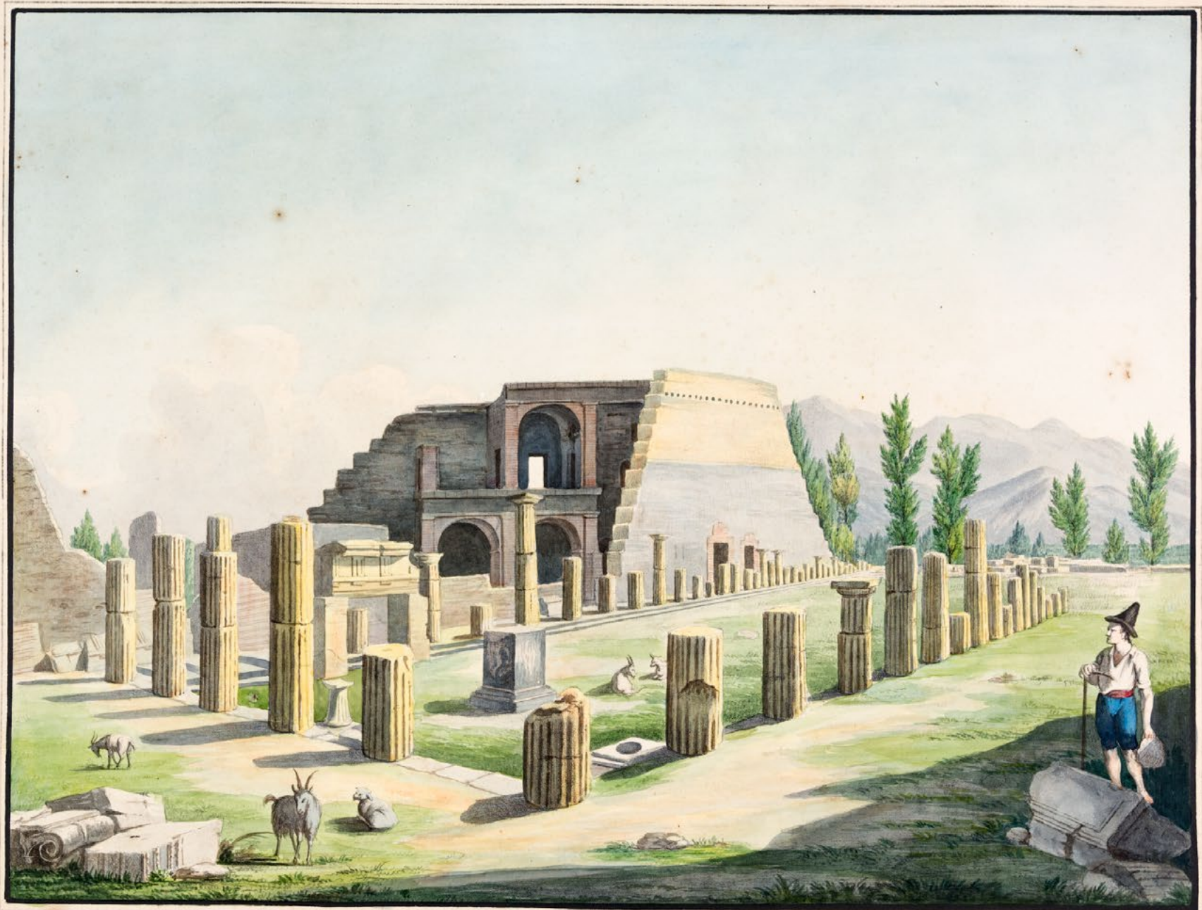
LA GRANDE COLONNADE DERRIERE LES DEUX THEATRES.