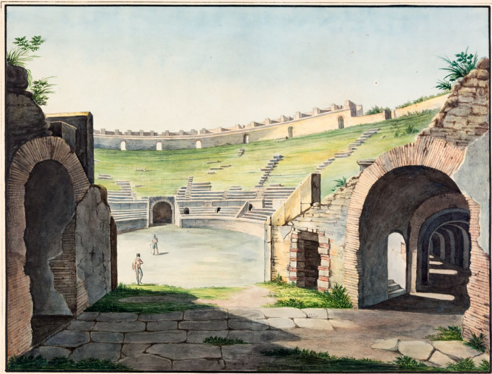
L'AMPHITHEATRE DE POMPEI.