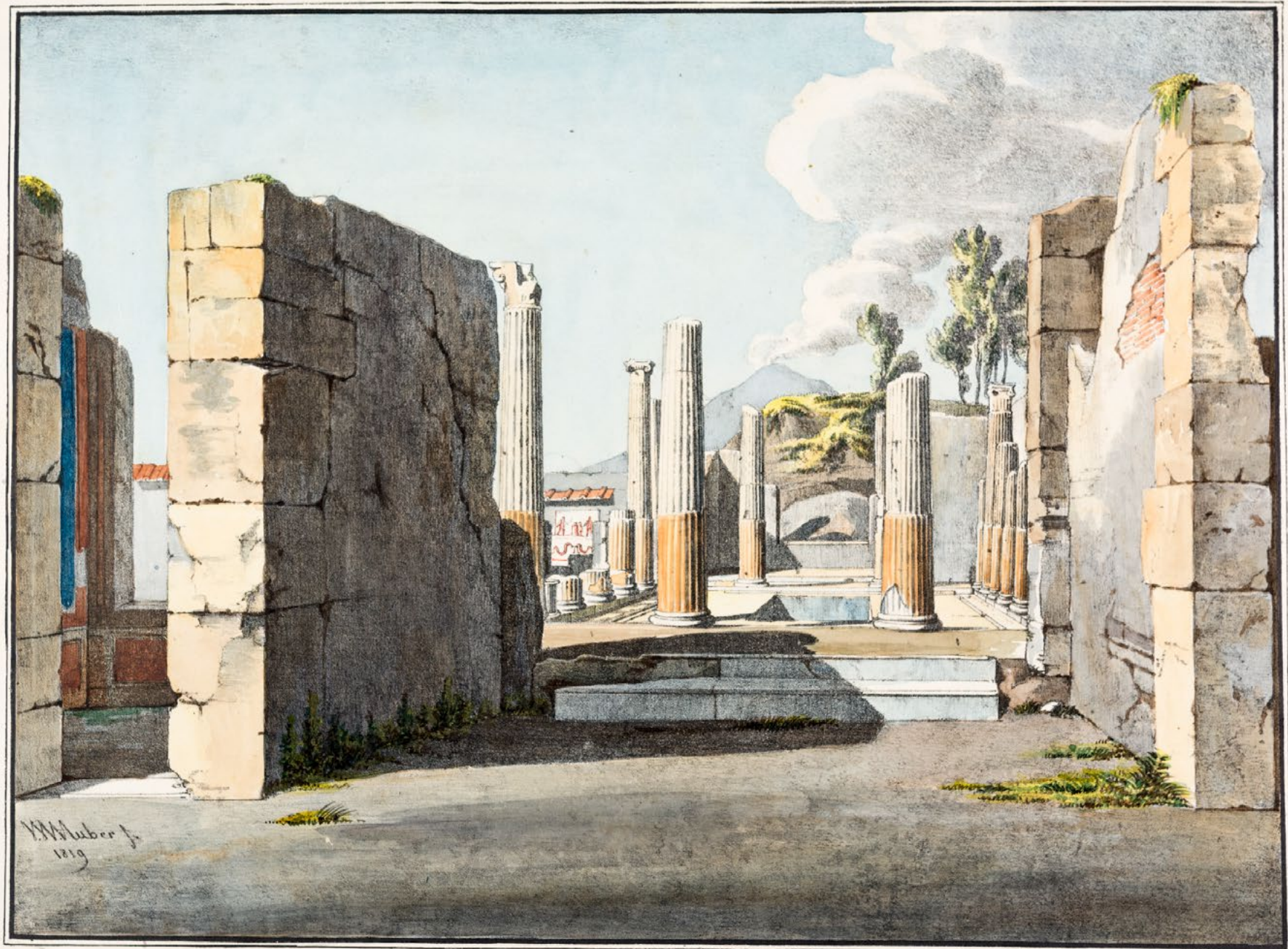
L'INTÉRIEUR DE LA MAISON PANZA.