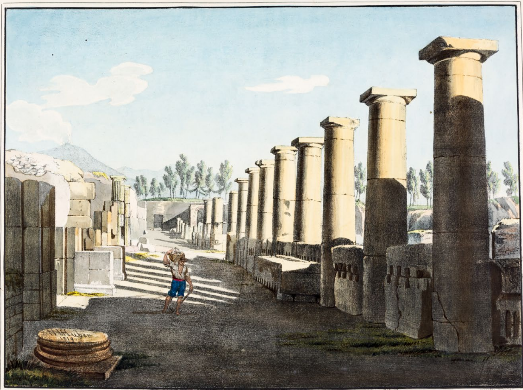
L'ENTRÉE DANS LA BASILIQUE