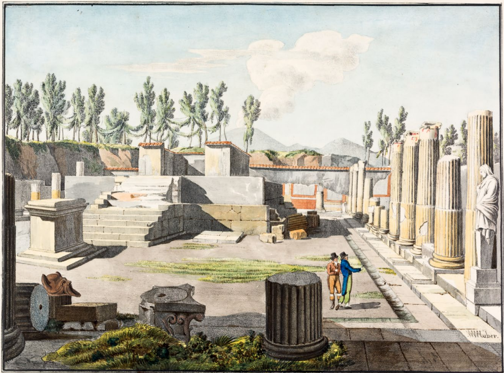
RUINES DU TEMPLE DE VENUS.