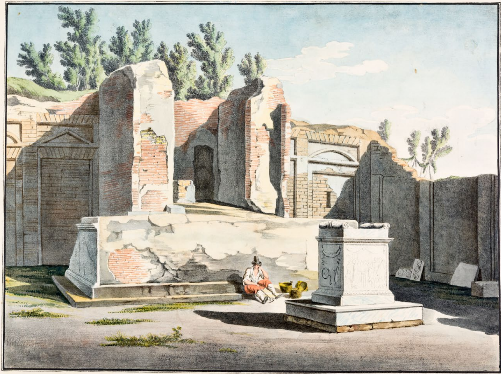
RUINES DU TEMPLE DE MERCURE .