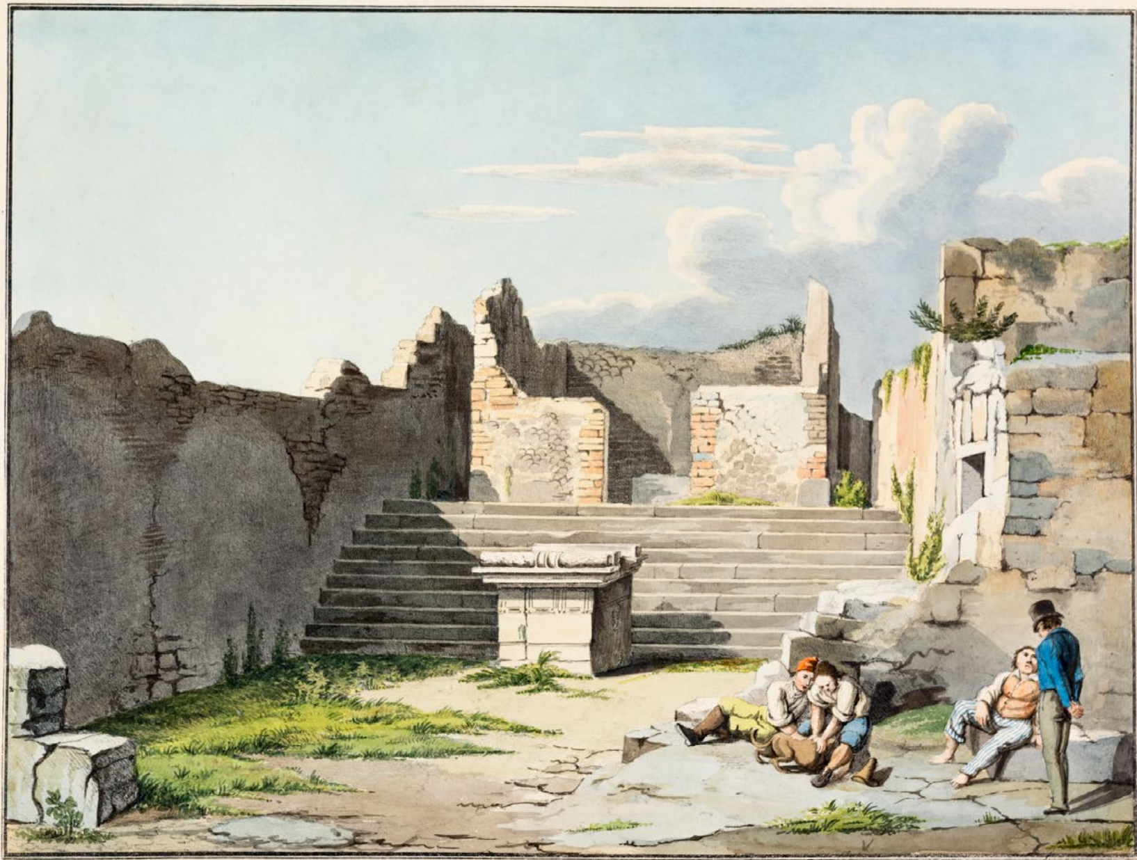
RUINE DU TEMPLE D'ESCLAPE.