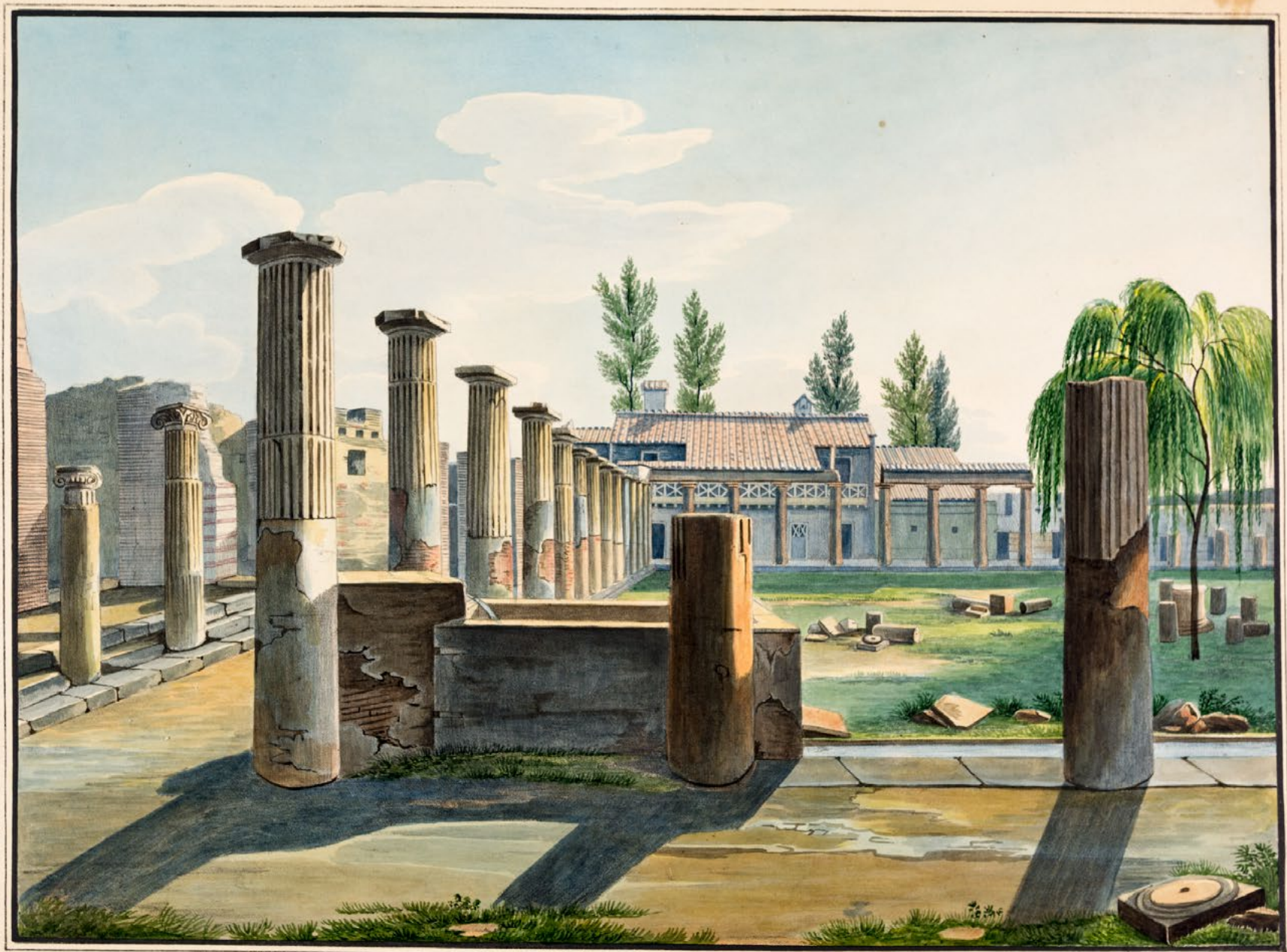
LE FORUM NUNDIARIUM, OU MARCHÉ PUBLIC .

communément appelé Quartier des Soldats.